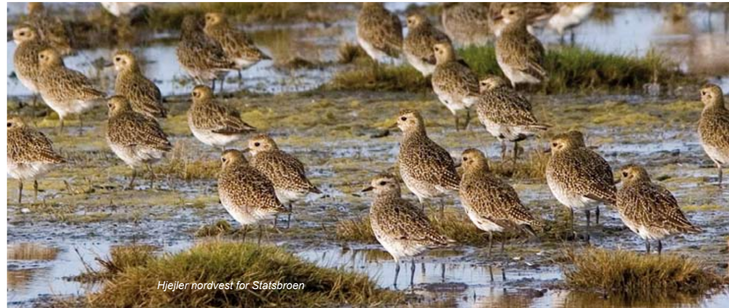
Hjejler nordvest for Statsbroen

Egholm anno 2009 har 55 faste beboere, hvoraf de fleste dagligt pendler til fastlandet til skole og på arbejde; ganske få lever i dag som fuldtidslandmænd.