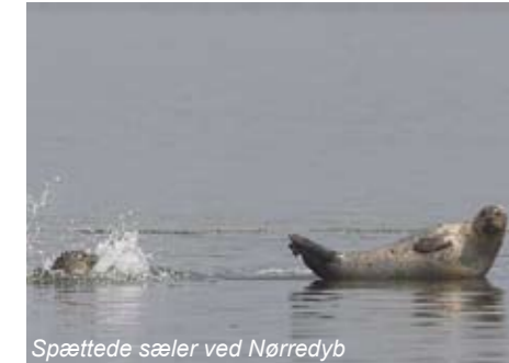
Spættede sæler ved Nørredyb