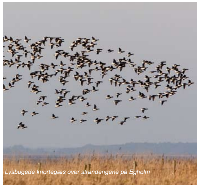
Lysbugede knortegæs over strandengene på Egholm