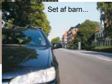
Set af barn...

Det er en god idé, hvis du som forælder gentagne gange går eller cykler barnets skolevej sammen med dit barn.