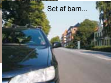
Set af barn...

Det er en god idé, hvis du som forælder gentagne gange går eller cykler barnets skolevej sammen med dit barn.