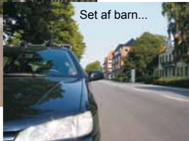
Set af barn...

Det er en god idé, hvis du som forælder gentagne gange går eller cykler barnets skolevej sammen med dit barn.