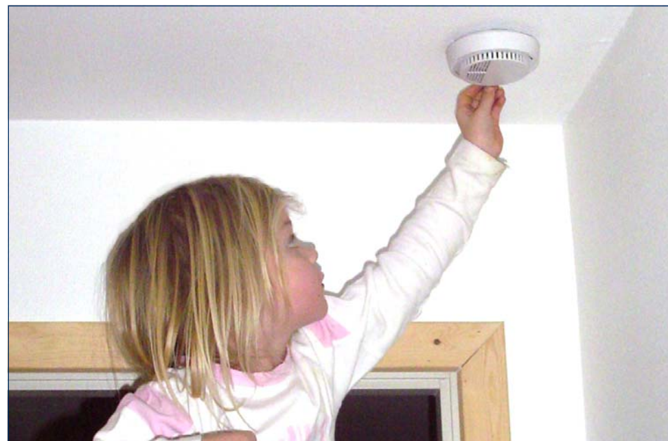
Der skal i dag være installeret røgalarm i alle rum, der anvendes til midlertidig overnatning.