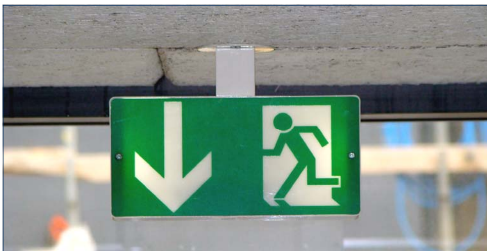
Skilte med "den flygtende mand" angiver flugtvejen ved brand.