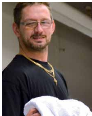
Medarbejder hos Berendsen.

- Vi har naturligvis først og fremmest et ansvar for vores virksomhed, for kunderne, produktionen, miljøet og økonomien. Men vores virksomhed er jo også en del af et samfund og vi har også et medansvar for at samfundet omkring virksomheden fungerer. Kun ved at tænke i helheder sikrer vi fundamentet under vores egen lokale virksomhed, argumenterer chefen.