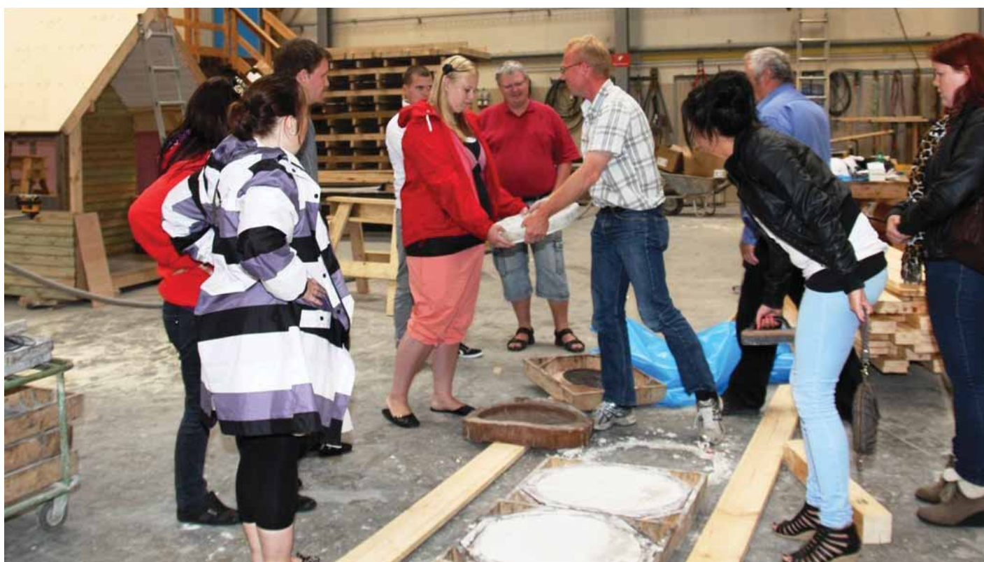
Deltagere i aktivitet på "Klar-Parat-Start"