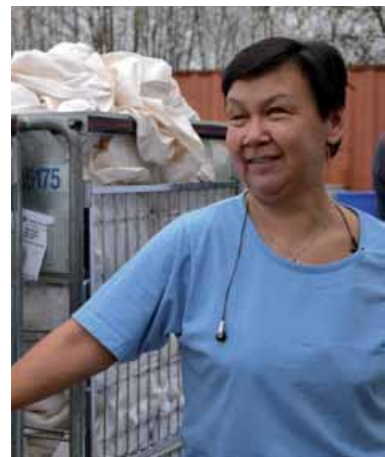
Medarbejder hos Berendsen.

Her produceres som i en ganske almindelig virksomhed. Men arbejdsdagens centrifuge snurrer lidt langsommere inde i skånevaskeriet – og tiden til de individuelle hensyn er lidt større.