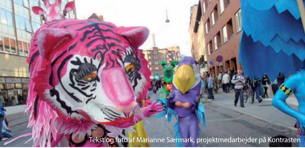
Tekst og foto af Marianne Særmark, projektmedarbejder på Kontrasten