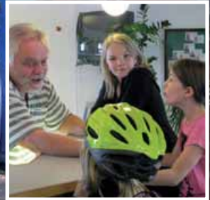
Aktiviteter ved Fritidscentret Højvang.

aktivitets-karusellen, og på den anden side er de børn, der har brug for ekstra opmærksomhed".