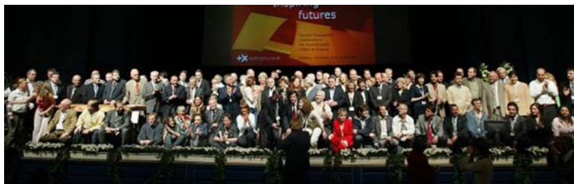
100 europæiske borgmestre efter underskrivelsen af Aalborg Commitments på Aalborg +10 konferencen 2004

Aalborg lægger navn til Aalborg Commitments, fordi dokumentet blev besluttet på den 4. internationale konference i Aalborg i 2004 i regi af den Europæiske Kampagne for Bæredygtige Byer.