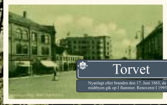
Torvet Nyanlagt efter branden den 17. juni 1865, da hele midtbyen gik op i flammer. Renoveret i 1995.