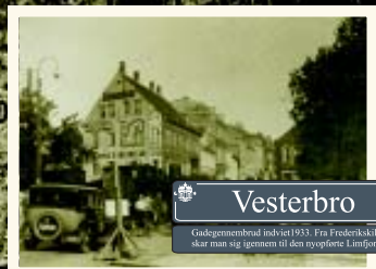
Vesterbro Grænseområdet indviet 1933. For Frederikskilde blev man bygget gennem til den nye Limfjordsbro.